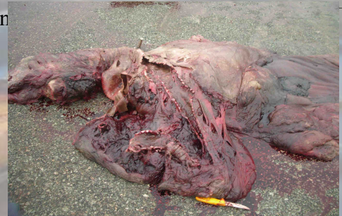
Lunge und Luftröhre (oder was daraus geworden ist)

Eine der Hoffnung des Sezierteams ist es, die Todesursache heraus zu finden. Alle hatten Bandwürmer. Einer fand scheinbar recht wenig Nahrung in letzter Zeit. Es wurden nur wenige Tintenfischschnäbel in seinem Magen gefungen. Ein anderer hatte jede Menge davon. Zusätzlich dazu aber auch noch ein mehrere Quadratmeter großes Fischernetz. Laut Experten war dies jedoch nicht die Todesursache.