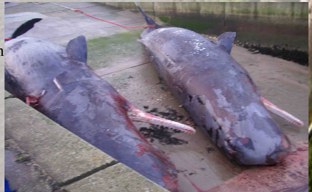
Die Helgoländer Wale

Hier auf Nordstrand wurden die beiden Wale von Helgoland und der von Büsum angelandet. Am Holmersiel wurden sie an Land gezogen, und dann vom LKN und der Wildtierforschung von Büsum zerlegt. Die beiden Helgoländer Wale wurden skelettiert. Die Knochen sind noch in der weiteren Verarbeitung, später werden sie dann ausgestellt. Davor muss man das Fett aus den Knochen kochen. Sonst stinkt und verwest das Skelett.