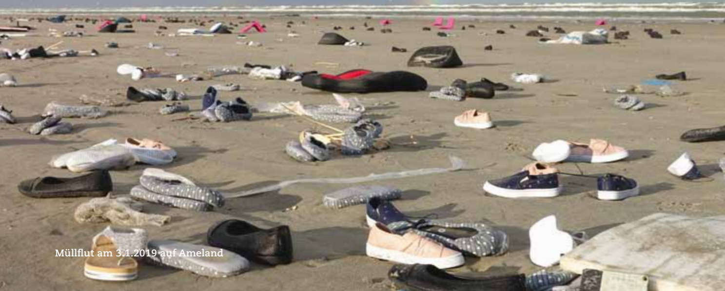
Müllflut am 3.1.2019 auf Ameland

„Containerschiffe werden immer größer und der Anteil großer Schiffe in der Flotte“ steigt. „Die Untersuchung offenbart, dass das Konzept zur Laschung von Containern an Deck auf diesen großen und breiten