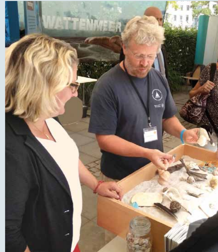
Mit Bundesumweltministerin Svenja Schulze am Infostand zum BeachExplorer am 17.8.2019 in Berlin.