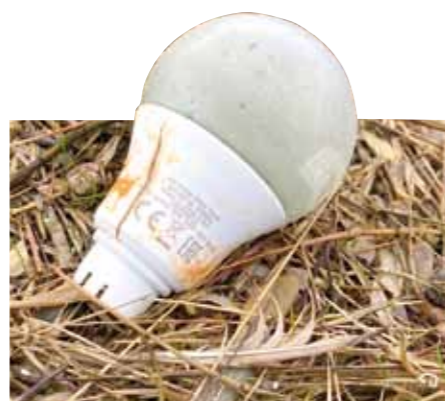
Weit verbreitete Gegenstände aus der Ladung der MSC Zoe: Wie viele zuvor wurden dieser LED-Lampen-Rohling und die Plastik-Orchidee (auf Seite 8) am 2.1.2021 genau zwei Jahre nach der Havarie in einem frischen Spülsaum vor Eiderstedt gefunden.

rungen. Die hierbei „aufgetretenen Querbeschleunigungen befanden sich nahe den Auslegungsgrenzen und führten zu einem Versagen der Containerstruktur und/oder des Laschmaterials und darauffolgendem Überbordgehen von Containern.“