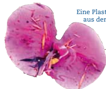
Eine Plastik-Orchidee aus der Ladung der MSC Zoe in einem Spülsaum vor Eiderstedt.